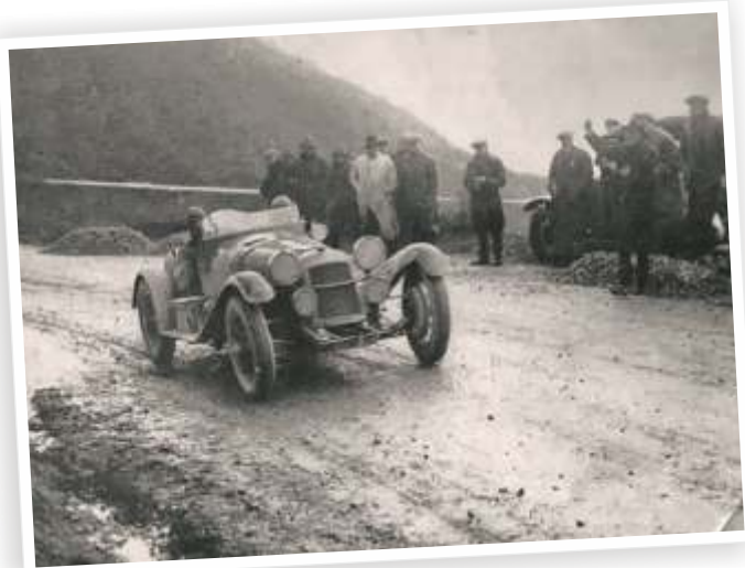
Maserati Tipo 26R (1926)

Onverwacht overlijdt Alfieri Maserati in 1932. Zijn broers zetten het bedrijf voort en halen Bindo bij het bedrijf. Helaas zijn ze zakelijk minder onderlegd dan Alfieri, maar wel technisch briljant, wat resulteert in prima racewagens. In 1937 wordt het bedrijf noodgedwongen overgedaan aan de Modenese staalmagnaat Adolfo Orsi, die de productie naar Modena verplaatst. De broers blijven tot 1947 contractueel bij Maserati als adviseurs, maar daarna nemen ze ontslag en beginnen in Bologna opnieuw onder de naam O.S.C.A. De tweede helft van de jaren dertig wordt gedomineerd door de opkomst van de Duitse racerij, en Maserati zoekt zijn heil in de kleinere raceklassen. Aan de vooravond van WO II boekt Maserati nog wél grote successen in de Verenigde Staten, waar Wilbur Shaw met zijn Maserati 8CTF Boyle Special de Indy 500 in 1939 en 1940 tweemaal op rij wint.