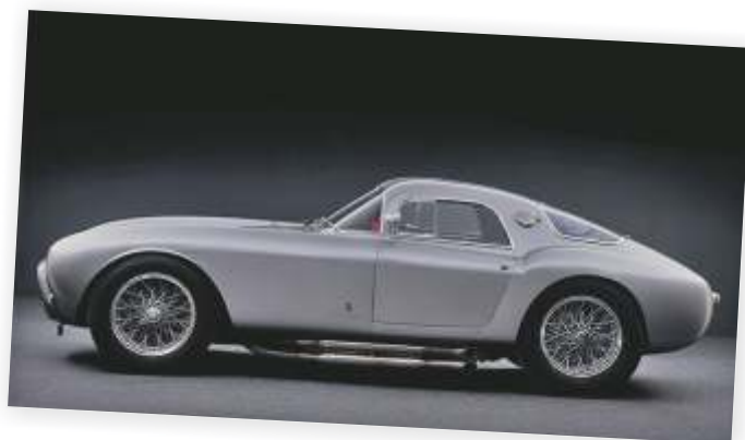
Maserati A6GCS Berlinetta (1954)

Maserati start vrij snel na WO II weer met racen. In 1946 ziet de A6 1500 Gran Turismo het levenslicht, bedoeld voor straatgebruik, gevolgd door de A6G- en A6GCS-competitiemodellen. De A6GCM Formule 2 uit 1951 is een mijlpaal die de opmaat vormt voor de beroemdste Maserati van allemaal: de 250F. Daarmee behaalt Juan Manuel Fangio in 1957 het wereldkampioenschap Formule 1. In deze gloriejaren is Maserati aan beide zijden van de oceaan succesvol met modellen als de 150S, de 250Si en de 300S. Als in 1957 echter het noodlot toeslaat tijdens een massacrash in Caracas, Venezuela, is Maserati in een klap haar hele sportwagenstal kwijt. Orsi besluit dat het toch al niet financieel solide Maserati voortaan alleen nog luxe straatauto's zal produceren en stopt met de fabrieks racerij. Racewagens worden alleen nog op bestelling gebouwd en dit resulteert onder andere in de wereldberoemde Birdcages.