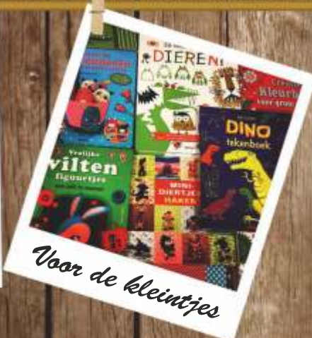
Voor de kleintjes