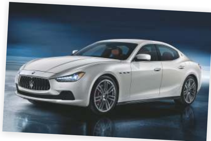
Maserati Ghibli (2013)

schap binnen te halen, wat in handen van het Duitse VitaPhone Racing maar liefst 6x op rij lukt. Maserati lanceert met de Maserati Trofeo racer tevens een nieuw merkkampioenschap dat staat als een huis en de succesvolle Quattroporte V is de wegbereider van een nieuw tijdperk, dat met de in 2013 geïntroduceerde Ghibli een wereldwijde speler op de luxemarkt moet opleveren. Bij zijn 100e verjaardag is Maserati een merk dat tot de verbeelding spreekt, allerlei ellende heeft overleefd en nog steeds staat voor Italiaanse flair en sportiviteit.