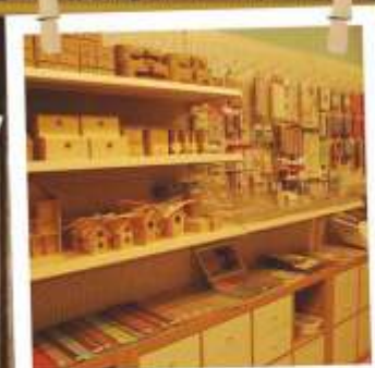
Voor de liefhebbers

schilderen - vilt - kaarten maken - lint - decoupage - sieraden - klei