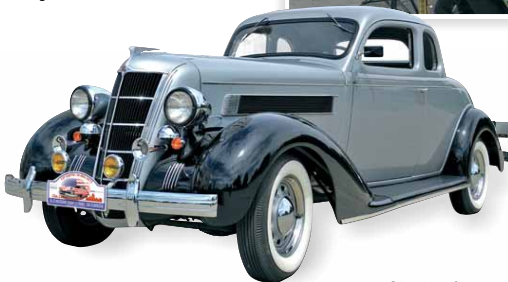
1935 Chrysler Airstream