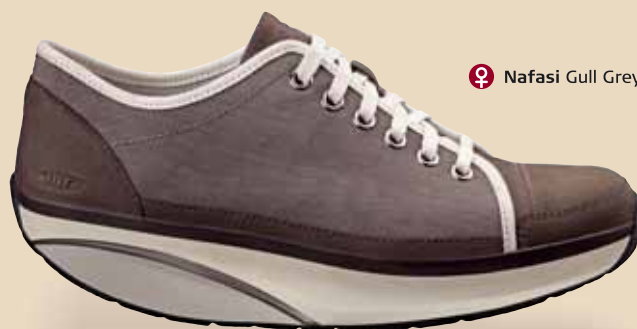
Nafasi Gull Grey

Wellicht hebben wij de oplossing voor u!