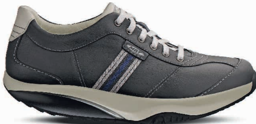
Model: Tembea M Caviar Black